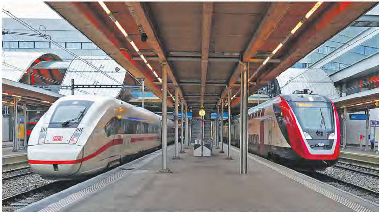
La cooperazione invece della concorrenza nel trasporto ferroviario internazionale di passeggeri ha dimostrato la sua validità. Dovrebbe rimanere tale.

Michael Spahr michael.spahr@sev-online.ch