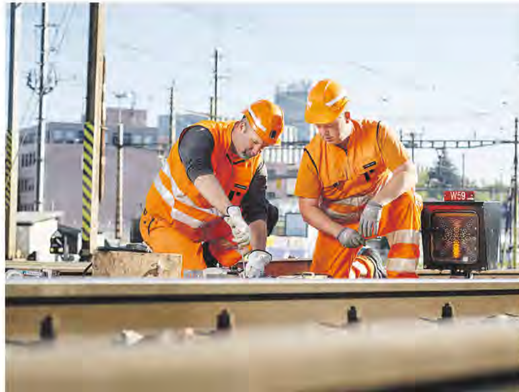
I tecnici specializzati sono particolarmente ricercati nelle ferrovie, come in ogni altro settore.