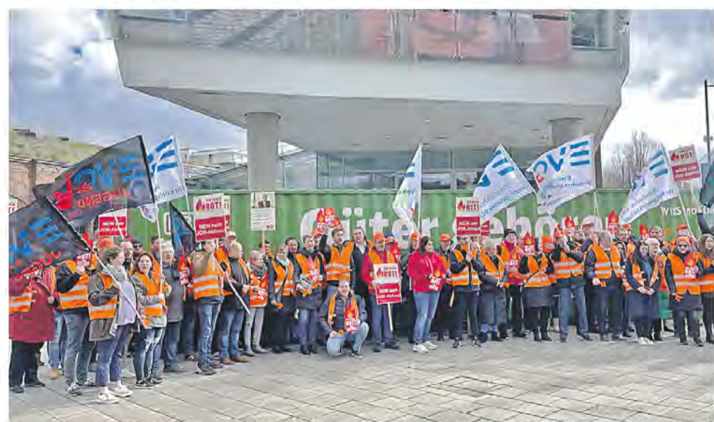
Sede DB Cargo: oltre 100 ferrovieri protestano contro l'esternalizzazione del personale.

Il consiglio di amministrazione di DB Cargo vuole trasferire tutte le sue attività di trasporto combinato in filiali e impiegare 1.500 addetti alle spese generali e alla produzione in condizioni di lavoro diverse. Per il sindacato EVG, questo smembramento della più grande azienda di trasporto ferroviario tedesco mette a rischio l'intero settore del trasporto ferroviario europeo e diritti e interessi di codecisione dei dipendenti. I membri dell'EVG hanno protestato davanti alla sede centrale di DB Cargo a Mainz il 23 febbraio. Il SEV ha inviato un messaggio di solidarietà.